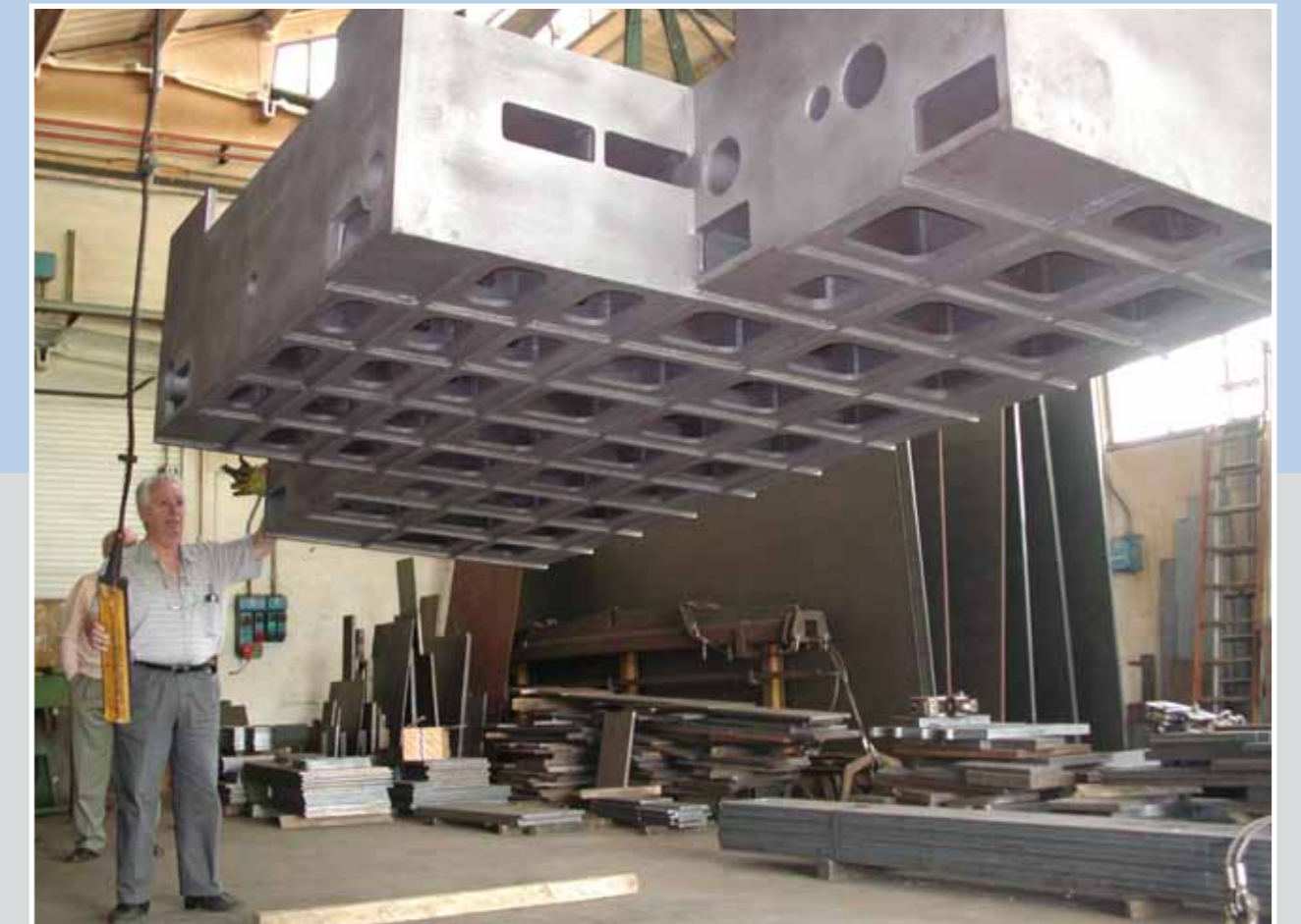
5000 x 2400 x 1000 H 7000 kg