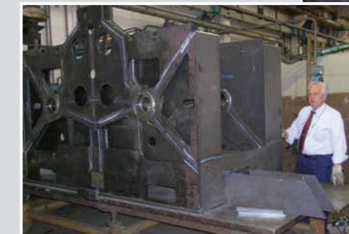
3260 x 1800 x 2000 H 3800 kg