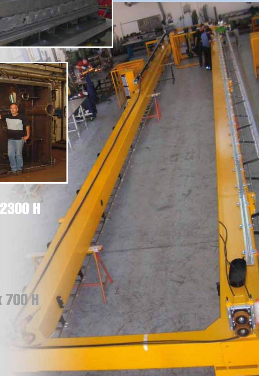
18000 x 3000 x 700 H 6000 kg