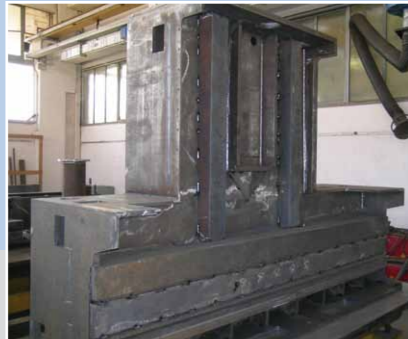
3000 x 1500 x 2200 H 5000 kg

La société, forte de plusieurs décennies d'expérience en créant des structures métalliques pour nombreux domaines de première importance, souporte ses clients en agissant comme un véritable partenaire de projet, en fournissant aux clients l'expertise, contribuant ainsi à identifier les méthodes et technologies les plus efficaces pour réaliser et développer les produits, dès la phase de conception.