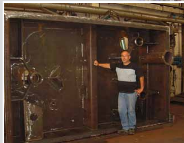
4000 x 1500 x 2300 H 5000 kg