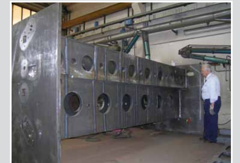
6000 x 1500 x 1800 H 5500 kg